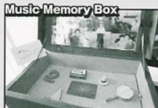
人の思い出に関連したオブジェと曲が詰まったbox