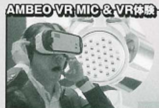
VR用マイク&ゴーグルを使った音と映像の仮想現実体験