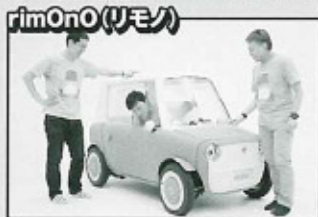
個性的でカワイイ音が鳴る超小型モビリティ

架空の街「サウンドデザインシティ」を散策し、作品に出会ったり、触れ合ったりすることで音の可能性を体験・発見する楽しみが生まれます。市内楽器メーカーや国内外で活躍するアーティスト、ユネスコ創造都市ネットワークの海外・国内連携都市などから提供された「音」に関連する作品があなたをお待ちしています。